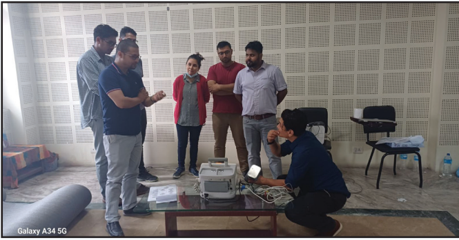
NBMS CPD तालीम