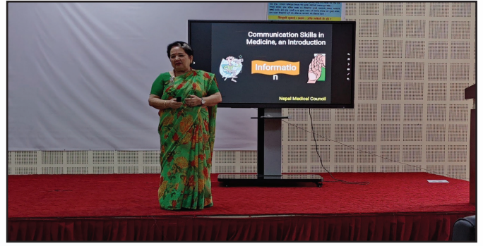
NBMS CPD तालीम