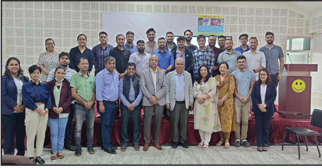
NBMS CPD तालीम