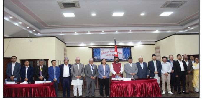
आयोगको चौधौँ बैठक