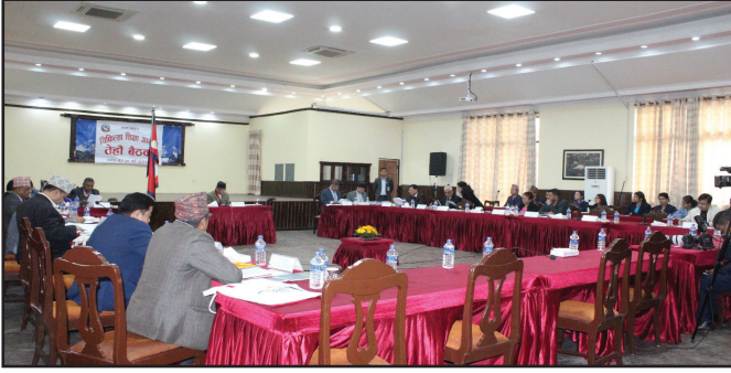
आयोगको तेहौँ बैठक