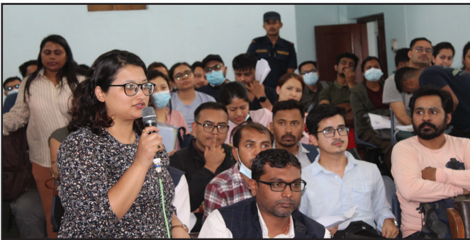
म्याचिड कार्यक्रमसम्बन्धी केही झलकहरू