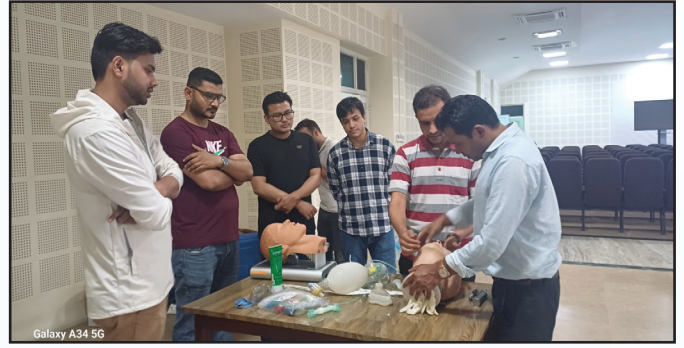
NBMS CPD तालीम