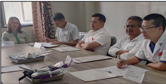
एनबिएएमएस कार्यक्रमसम्बन्धी केही झलकहरू