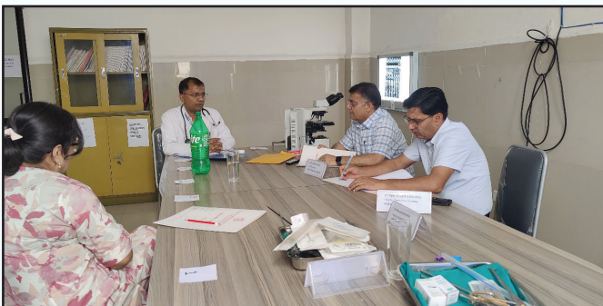
NBMS आन्तरिक मूल्याङ्कन