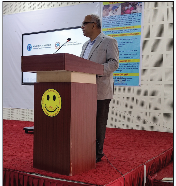
CPD तालीमको समापन समारोह