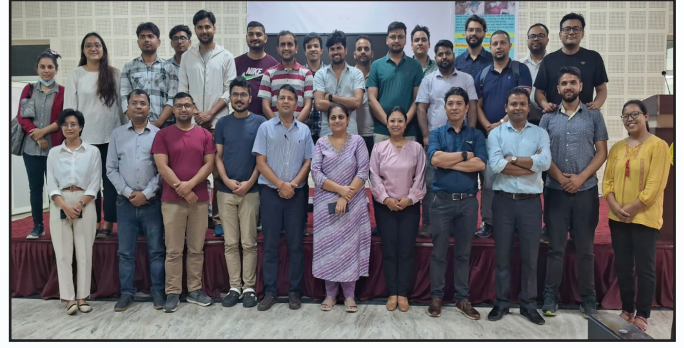
NBMS CPD तालीम