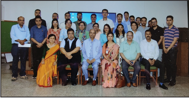
NBMS फ्याकल्टी विकास तालीम