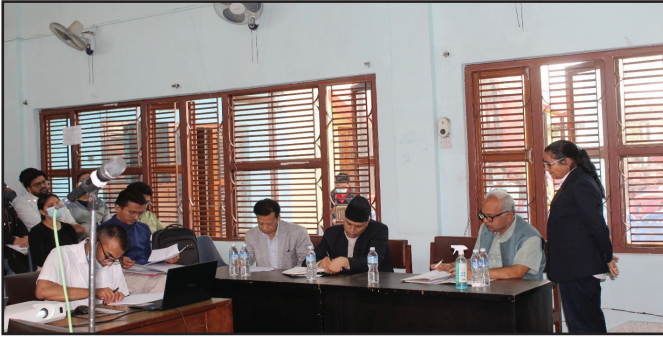
म्याचिड कार्यक्रमसम्बन्धी केही झलकहरू