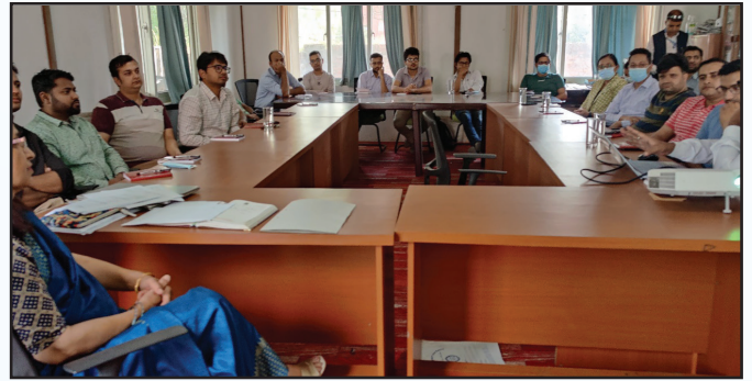
NBMS रेजिडेन्टहरूसँग अन्तर्क्रिया