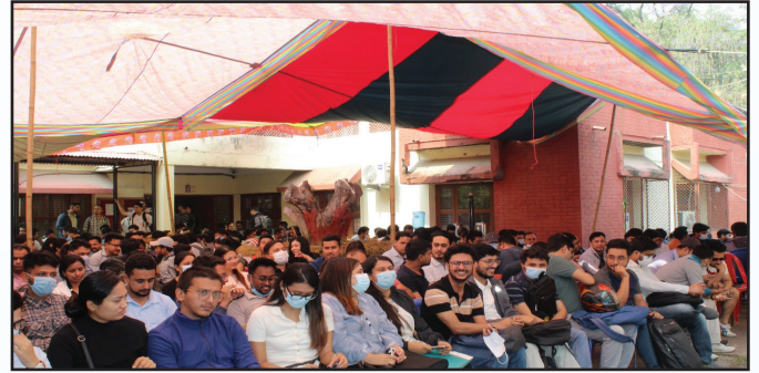
म्याचिड कार्यक्रमसम्बन्धी केही झलकहरू