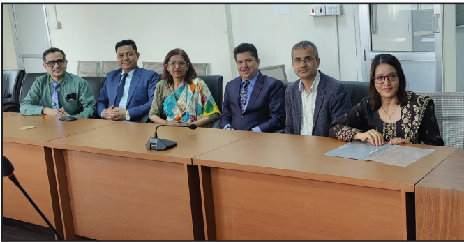
NBMS पाठ्क्रम निर्माण बैठक